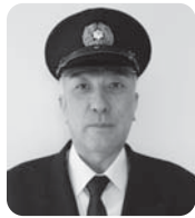
奈 良 巧 一 鹿角広域行政組合消防本部