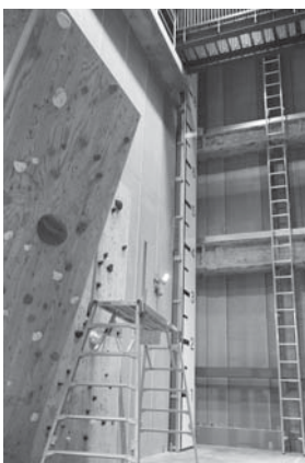
屋内訓練スペース

平成二九年一月に建設工事に着手し、平成三〇年五月に庁舎棟が完成、翌六月から新庁舎に移転し業務を開始しておりますが、その後、旧庁舎の解体、訓練棟の建設、出動スペースの整備を行い、平成三一年四月二五日にすべての工事が完了しております。 庁舎棟には、一階に消防車両を格納する車庫や資機材庫、二階に仮眠室、女性職員専用スペース、屋内訓練室などの消防署機能、三階に高機